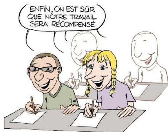
L'Évaluation par contrat de confiance